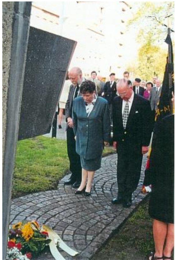
8 Mei 1998: Het bestuur van het 8 Mei Comité bracht een bloemenhulde aan het monument van de Politieke Gevangenen.