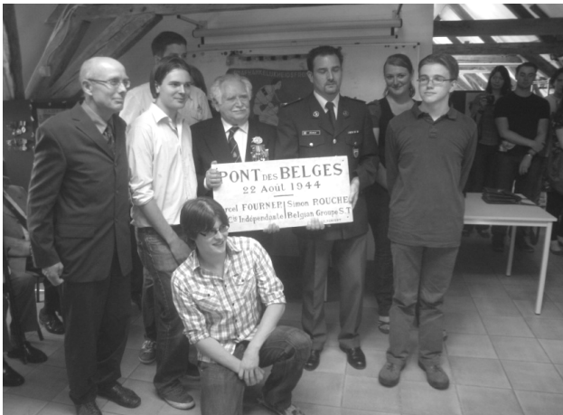
06/07/2010 : overhandigingceremonie in het museum van Deportatie en Verzet, Kazerne Dossin.