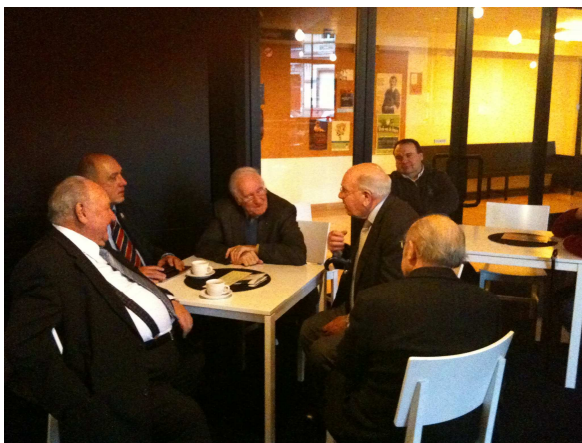
Enkele getuigen in gesprek in de cafetaria van het Cultureel Centrum en de filmposter van The Swing Kids