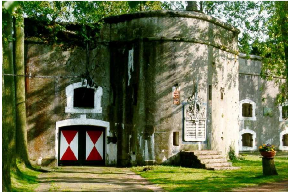
Foto : Schans van Dorpveld - plek van de herdenking te Sint-Katelijne-Waver

Daarnaast waren we ook aanwezig op het prachtige Galaconcert van de Reserveofficieren geweest Mechelen te Heist-op-den-Berg en de boekvoorstelling 'Beulen van Breendonk' in het Fort van Breendonk.